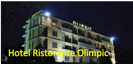
Hotel Ristorante Olimpic

Partite Punti 80 - Batterie da 8 Giocatori Vige Regolamento UISP 2016 - 2017 Divisa Nazionale Obbligatoria