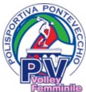
A.S.D. Polisportiva Pontevecchio